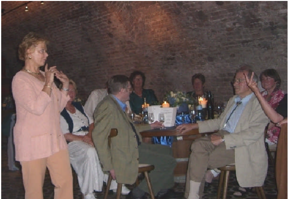
am Abend dann die gemeinsame fröhliche Runde im Weinkeller von Edesheim