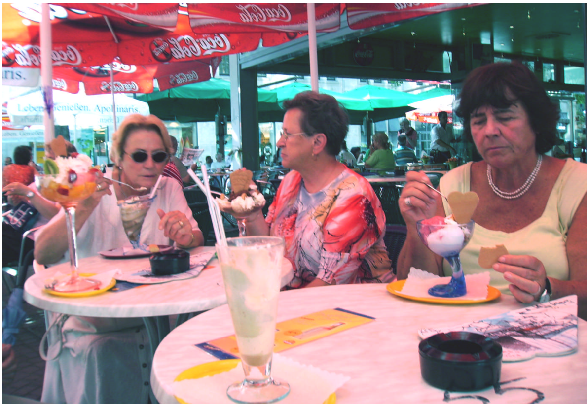
Die Damen erforschte in der Zeit Speyer mit Dom – da war natürlich eine Stärkung nötig!