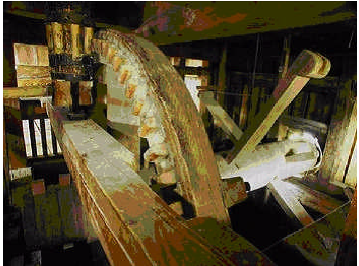
Im Freilichtmuseum Gutach