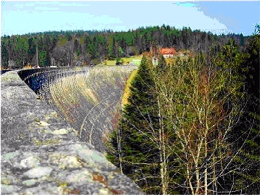
Zum Schluss dann noch die Besichtigung der Schwarzenbach-Talsperre