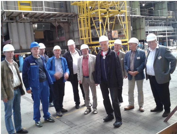
Rundgang der Gruppe 1

Die Dimensionen sind beängstigend. - Die Neptunwerft gehört zur Meyerwerft und baut Schiffsegmente für Kreuzfahrtschiffe von über 20 m Höhe und 40 m Breite.