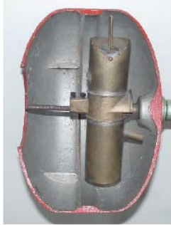
Verdampfer mit Ölrückführung für NH 3