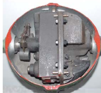
Verdichter mit Verflüssiger und Hochdruck-Schwimmer

Exponat: vollhermetische Kältemaschine AS Rotor bzw. Rot- Silberautomat Ausführung mit Ölrückführung für NH 3