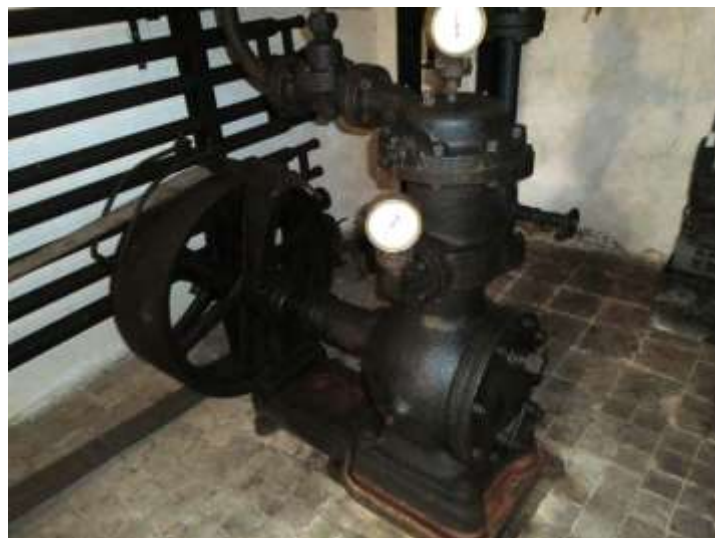
CO 2 Verdichter von Haubold um 1920